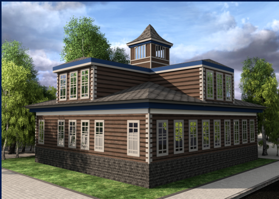
город Каргополь Дом купца Вагера (начало 20 века)