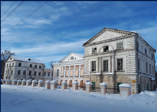
город Сольвычегодск Дом семьи Пьянковых