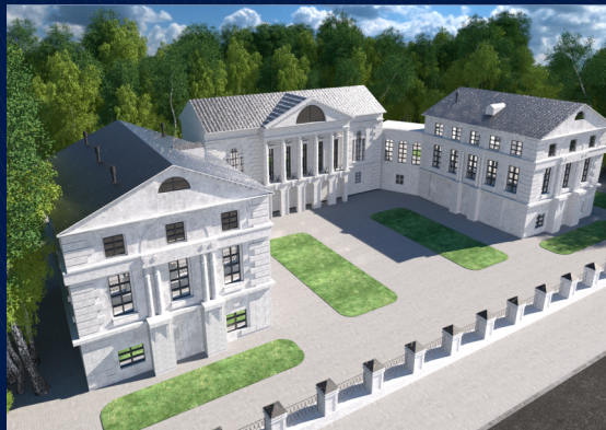
Кадастровые номера участка 29:07:061203:1407